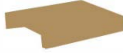
1 adet küçük boy raf ( B )