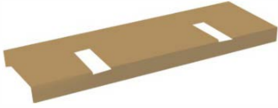
1 adet alt taban parçası ( A )