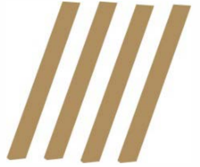
4 adet dikme ( C )